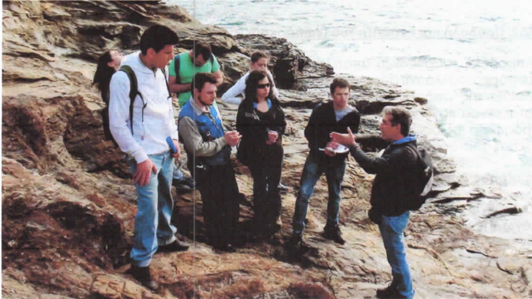
Φωτογραφία 4: Επίσκεψη φοιτητών του Τμήματος Γεωλογίας ΕΚΠΑ.

Αυτά τα ρήγματα είναι που προκάλεσαν τη δημιουργία χώρου, ώστε τα μάγματα να ανέλθουν πολύ κοντά στην επιφάνεια της Γης και να συμπαρασύρουν τα πηκτικά συστατικά και τα μέταλλα. Και μέσα από περίπλοκες και σύνθετες διεργασίες, με τη βοήθεια των υδροθερμικών διαλυμάτων, σχηματίστηκαν τα κοιτάσματα του Λαυρίου σε μία περιοχή που εκτείνεται από το Σούνιο έως βόρεια της Πλάκας, μήκους 13 χλμ. και πλάτους >5 χλμ.