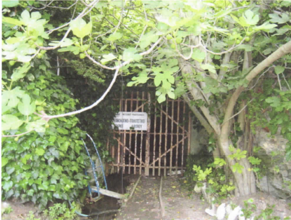
Φωτογραφία 2: Εξωτερική άποψη της στοάς 80.

Ο συγκεκριμένος γεώτοπος συγκεντρώνει το διεθνές ενδιαφέρον όλων των ειδικοτήτων των γεωεπιστημών, ενώ αξιοσημείωτη είναι η επισκεψιμότητα φοιτητών από Πανεπιστημιακά Ιδρύματα τόσο εγχώρια, όσο και του εξωτερικού. Εκπαιδευτικά προγράμματα σχεδιάζονται με πυρήνα τη βιωματική μάθηση στις γαλαρίες της στοάς 80. Η ανάπτυξη του περιβάλλοντος χώρου, καθώς και η ανάδειξη του κτιρίου που στεγάζει τον χώρο επισκευής του μεταλλευτικού συρμού, του τρένου που μετέφερε το μετάλλευμα προς τον λιμένα του Λαυρίου, θα συμβάλει τόσο στην αύξηση της επισκεψιμότητας, όσο και στη δυνατότητα, επισκέπτες που δεν επιθυμούν να εισέλθουν στη στοά να αποκτήσουν την εμπειρία, επισκεπτόμενοι το κτίριο στον εξωτερικό χώρο.