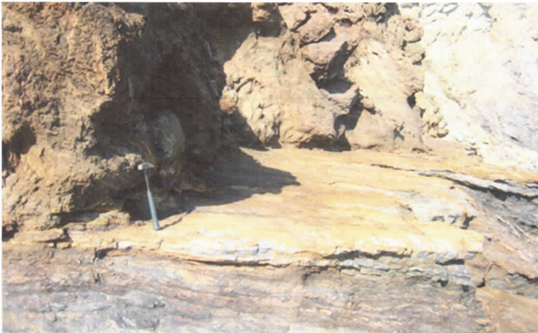
Φωτογραφία 3: Επιφανειακή εκδήλωση ρήγματος αποκόλλησης, Αυλάκι.

Στη Λαυρεωτική, τα ρήγματα αποκόλλησης και τα συναφή φαινόμενα έχουν εντυπωσιακή ανάπτυξη και εξαπλώνονται σε μια τεράστια περιοχή, τόσο στο επιφανειακό ανάγλυφο, όσο και στα δαιδαλώδη, υπόγεια συστήματα των μεταλλευτικών στοών. Το πολύ μεγάλο αυτό Δυτικό - κυκλαδίτικο Σύστημα Τεκτονικής Αποκόλλησης διασχίζει την Λαυρεωτική, με εντυπωσιακή εμφάνιση στην παραλία του παραθεριστικού οικισμού Αυλάκι (Πόρτο Εννιά) και εκτείνεται σε ένα συνολικό μήκος άνω των 100 χλμ., στα δυτικά όρια του Αττικο-Κυκλαδικού Μεταμορφικού Συμπλέγματος.